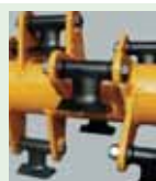
n°18 Martillo giratorio para: madera Ø max cm 8