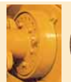
Rotor equilibrado electrónicamente