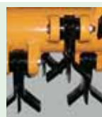
n°36 + 18 Cuchillas rectas multiuso para: hierba, arbustos, poda, madera Ø max cm 5