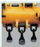
n°24 Martillo gancho para: hierba, cunetas, arbustos Ø max cm 2