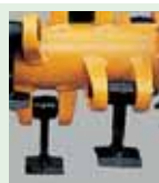
n°18 Martillo para: madera Ø max cm 6