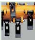
n°24 Cuchilla tipo espátula para: hierba, arbustos, poda, madera Ø max cm 1